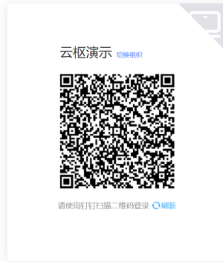
版权所有 ©深圳奥哲网络科技有限公司 粤ICP备10083177号