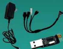
电源、TTL调试模块、尾线