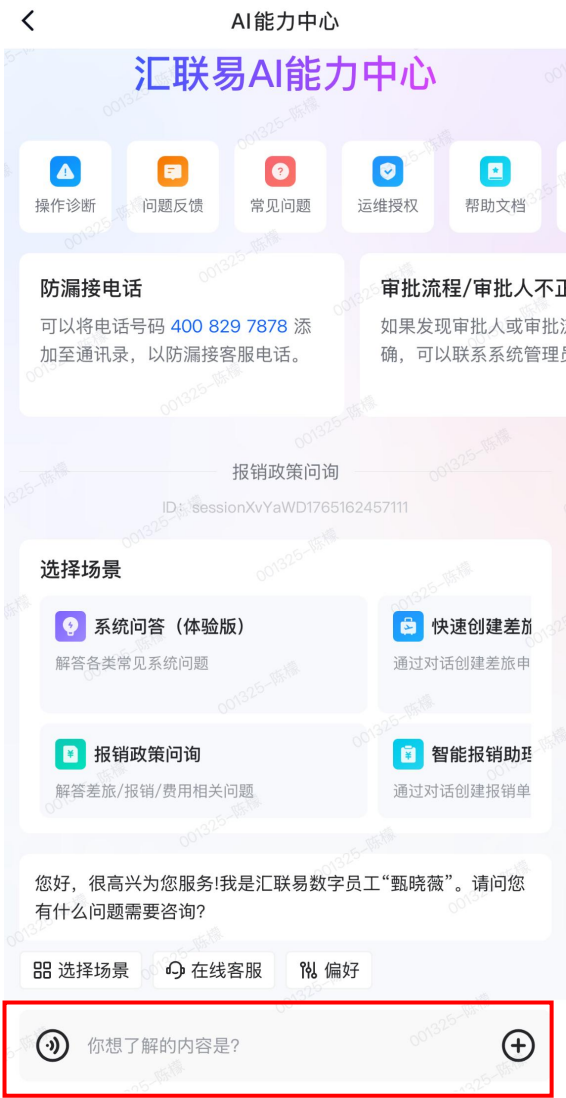
Step 1：在报销政策询问的场景下，在对话框中输入你的报销相关问题